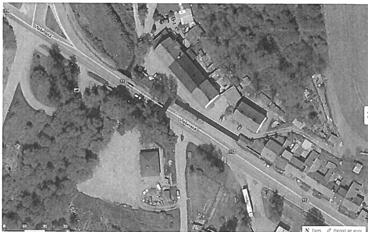
Příloha č. 1 – Rozsah úpravy – Červeně zvýrazněná plocha