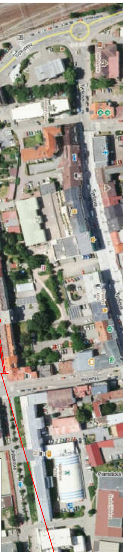
PŘEHLEDNÁ SITUACE UMÍSTĚNÍ STAVBY